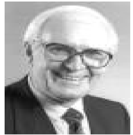
Dr. James w. Black, Premio Nóbel de Medicina, 1988

Capaces de aliviar enfermedades Causar Daño